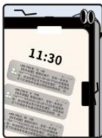
● 垃圾信息源源不断