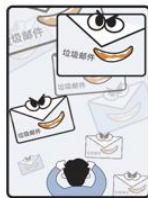
● 垃圾邮件铺天盖地