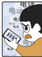
● 骚扰、诈骗电话接二连三